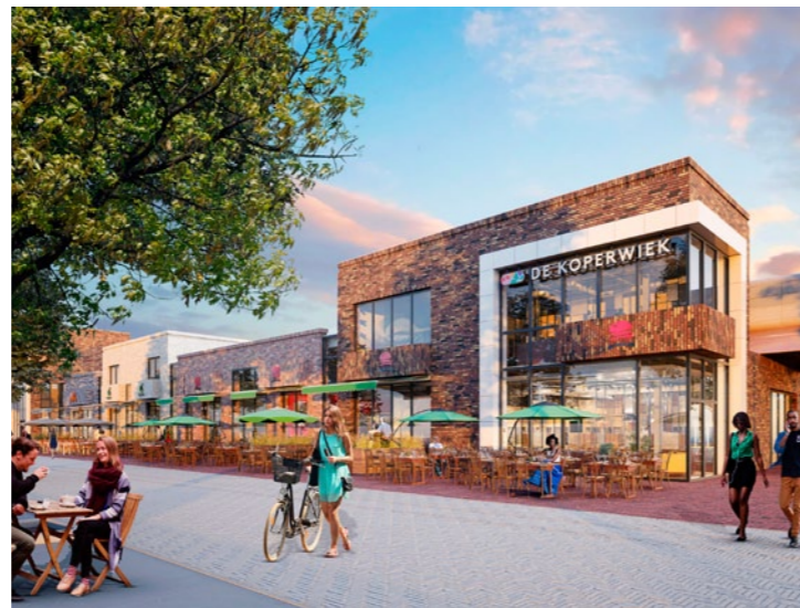
Horecaproject in de Koperwiek in Capelle aan den IJssel

De Hotelschool Leeuwarden blijkt een bakermat van Adhoc, naast Sluiter komen er nog vier medewerkers vandaan. 'In je vierde jaar ga je daar tien maanden op stage. Zo zijn er hier veel beland. Waar in elk geval het hele team zich in herkent, is de nieuwe slogan van Adhoc: 'waar horeca en vastgoed samenkomen'. Deze geeft aan dat ons werk behalve om stenen bijvoorbeeld ook om exploitaties, inventaris, personeel, formules et cetera gaat: het is nooit saai. Deze mix maakt het echt heel leuk.'